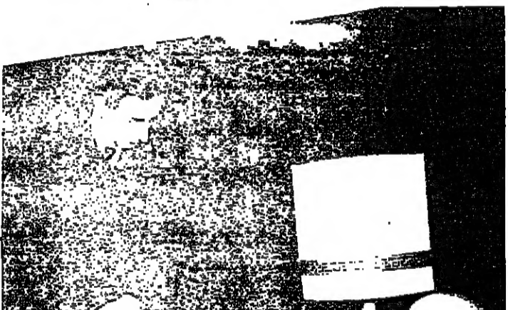
في لقاء مع الاديب ميخائيل نعيمة

في تقديمه لجموعة شعرية بعنوان « فرح » اصدرها جنبلاط عام 1977 ، كتب الاديب ميخائيل نعيمة عن جنبلاط الاديب والشاعر والمتصوف ما يلي : « ناظم هذه الاثني عشر القصيدة العربية رجل يهتديك منه تعدد نزعاته واتجاهاته وتساخلاته . فهو في صميم السياسة اللبنانية والعربية ، على ما في تلك السياسة من تشويش والنزاع وخبطشوا . وهو مؤسس « الحزب التقدمي الاشتراكي » ورئيسه ، ومحرر المقال الاتحادي في الصحيفة الطائفة بلسانته . وهو فوق ذلك ، الرجل المتصوف الذي يتعشق الحكمة ويستقيها من مصادرها العزوية المأخوذة « العقلاء » والحجورية من الدهماء ، ملما يستقيها من « الوان » المسيحية والاسلام ، وبخاصة من « النبتا » الهندية ، وما يفرغ عندهم شرب « الوفا » و « البنينا » اذينا » .